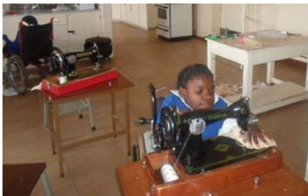
Praktijkexamens op de King George VI school, juli 2014