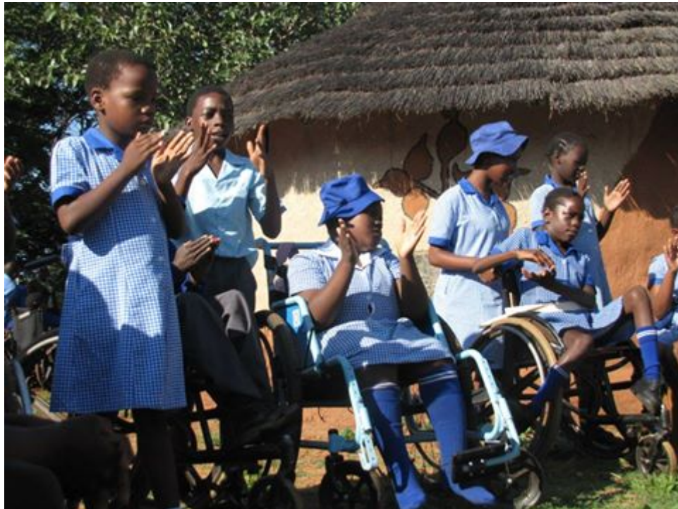
Culturele week, maart 2014