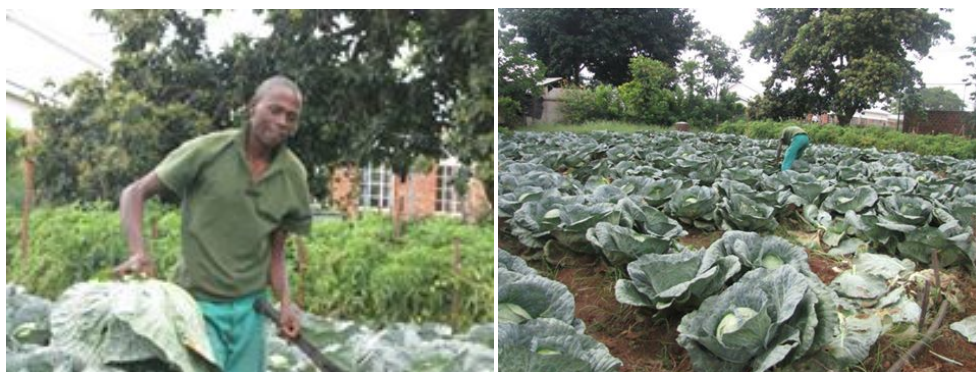
De moestuin van het King George VI centrum in maart 2014

Ook voor het KGVI centrum is helaas nog geen verbetering in de financiële situatie te melden. Het licht aan het einde van de tunnel is nog niet in zicht. Daarom hebben wij als bestuur van JKZ zo'n bewondering voor het management en alle staf van het centrum, dat ieder jaar er weer in slaagt de eindjes aan elkaar te knopen.