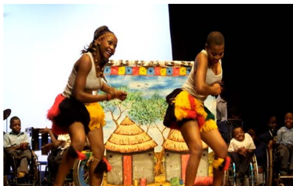
Dansvoorstelling op het KGVI centrum: Dancing Queen, september 2014

Activiteiten van het KGVI centrum zijn te volgen op Facebook .