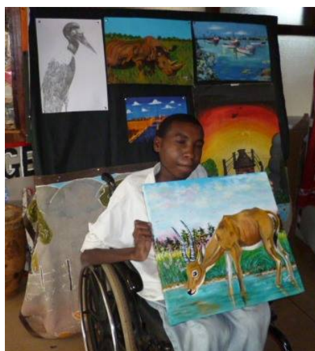
Kunsttentoonstelling door leerlingen van het KGVI centrum in de plaatselijke kunstgalerie