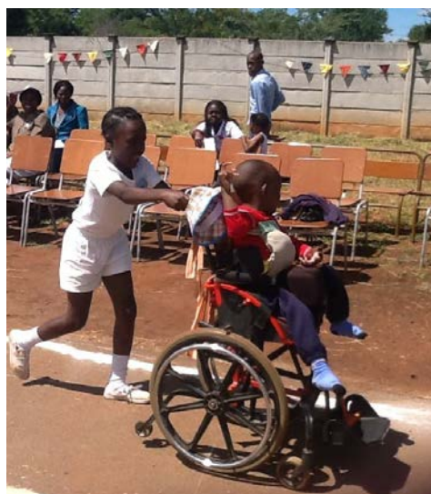
Sportdag in maart 2014

De kosten van JKZ bestonden ook in 2014 weer vooral uit algemene kosten zoals voor onze postbus, en de maandelijkse bankkosten voor het incasseren van de machtigingen.